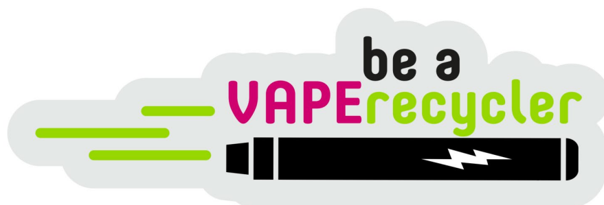
Figure: Le nouveau visuel clé de SENS eRecycling pour une élimination des cigarettes électroniques respectueuse de l'environnement.

La vente de cigarettes électroniques (vapoteuses) a fortement augmenté en Suisse au cours des dix dernières années. Les vapoteuses, dont l'augmentation annuelle est estimée par la branche à environ 30%, connaissent un véritable boom: en 2022, plus de 10 millions d'unités ont été importées en Suisse. On distingue ici les vapoteuses réutilisables des vapoteuses jetables. La plupart du temps, la durée de vie des vapoteuses jetables est atteinte après seulement 600 bouffées. La majorité d'entre elles finissent à la poubelle au lieu d'être recyclées. Et ce, bien que les cigarettes électroniques soient des appareils électriques qui devraient être éliminés dans les règles de l'art. C'est la raison pour laquelle SENS eRecycling a mis sur pied, avec les principaux importateurs et commerçants, une solution de branche pour une élimination des cigarettes électroniques respectueuse de l'environnement. La nouvelle solution sectorielle est en vigueur depuis le 1 er juillet 2023. Elle est également ouverte à tous les fabricants, importateurs et entreprises commerciales de cigarettes électroniques qui ne sont pas encore affiliés.